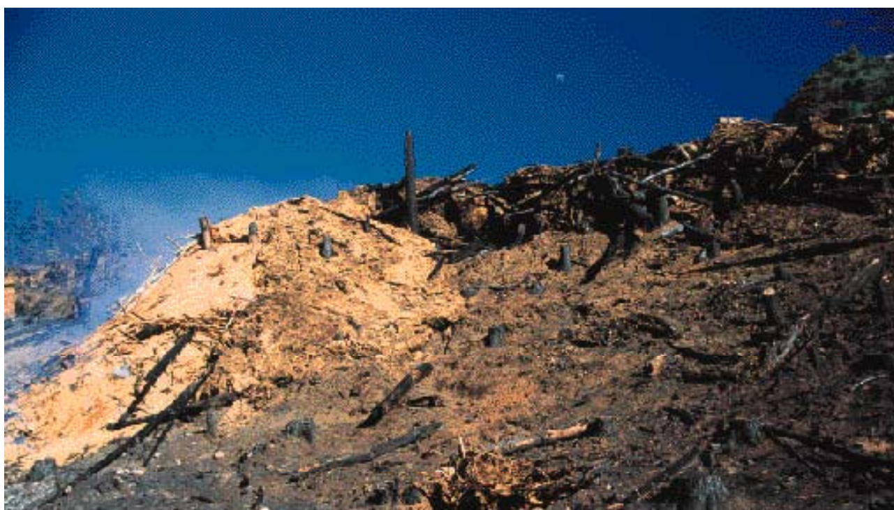
Una parte considerable de bosques en Chile ha estado sujeto a malas prácticas, tales como la tala rasa sin control, el excesivo pastoreo de ganado y los incendios forestales provocados. Se estima que aproximadamente el 45 por ciento de la cubierta de bosque original se ha perdido y que un 76 por ciento del bosque remanente está seriamente en peligro.

Hay alrededor de 226 especies de aves en el hotspot ; de las cuales sólo 12 son endémicas. Sin embargo el hotspot tiene dos géneros endémicos de aves: Sephanoides y Sylviorhynchus . El primero está representado por el picaflor chico de continente ( S. galeritas ) y el picaflor de Juan Fernández ( S. fernandensis ), que constituye la especie de ave más críticamente amenazada en Chile, confinada a las islas de Juan Fernández. El segundo género es monotípico e incluye al colilarga ( S. desmursii ), restringido a los bosques templados del centro-sur de Chile.